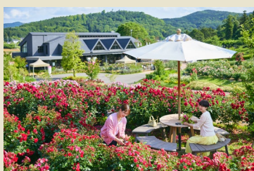
08 いばらきフラワーパーク