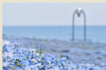
04 国営ひたち海浜公園